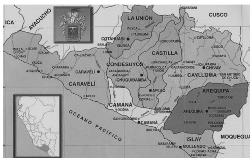
Figura 2. Mapa del Departamento de Arequipa y provincias

Actualmente el término loncco ya no evoca un tratamiento peyorativo sino más bien un sentimiento de identidad y tradición arequipeña, así como una relación cercana con el campo y sus diversos elementos. Al parecer muchos usos y significados han ido cambiando o desapareciendo en los últimos años. Contrariamente a lo que habíamos esperado en el análisis de los campos semánticos, los términos en el campo de la cocina y de la agricultura –elementos bastante arraigados en la tradición arequipeña– son mucho menos numerosos que el campo semántico de las acciones o formas de tratamiento. En la realidad, vemos que muchos de los elementos tradicionales en la cocina arequipeña como la ancana (ollita de barro para tostar la cancha) o el huinco (depósito hecho de calabaza y utilizado para mover o servir la chicha en las picanterías tradicionales de Arequipa) han sido remplazados por utensilios de cocina modernos de aluminio. Al desaparecer el uso utilitario, desaparece el uso del término y su significado.