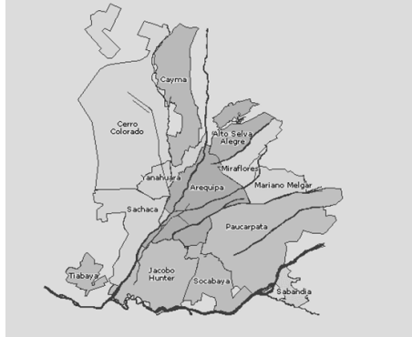
Figura 3. Mapa de la Ciudad de Arequipa y algunos "pueblos tradicionales"

comerciantes españoles de la ciudad de Arequipa (2011, p.64). Los españoles los llamaron indios comarcanos, los que se convirtieron en los chacareros mestizos, es decir los lonccos de la campiña arequipeña. Los descendientes del idealizado loncco minifundista serían los actuales habitantes de la campiña arequipeña (los distritos tradicionales de Paucarpata, Sabandía, Characato, Mollebaya, Quequeña, Yarabamaba, Pocsi, Chiguata, Polobaya, Yura, Tiabaya, Sachaca, Uchumayo y Socabaya).