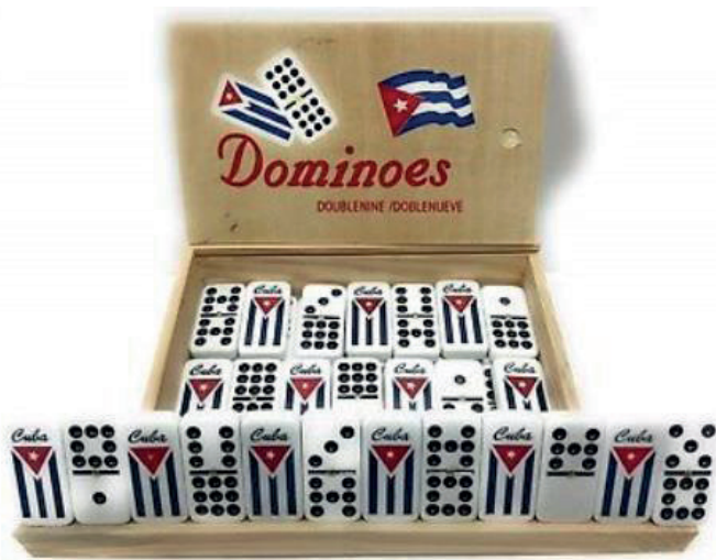
Imagen del dominó cubano (doble nueve).