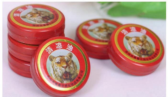
Imagen de pomada china.

imperial china. El mentol chino fue creado en 1870 por Hu Ziqin (胡子钦), herborista de dicha corte, que era un hakka de la provincia de Fujian, al sur de China. Luego, este herbolario emigró a Rangoon, Birmania. Allí abrió una pequeña herboristería y comenzó a comercializar su producto. Tras su muerte, sus dos hijos Hu Wenhui (胡文虎) y Hu Wenbao (胡文豹) perfeccionaron este medicamento y empezaron a producirlo de manera industrial (Pong, 2019, p. 201). El “bálsamo del tigre” comenzó a exportarse a otros países como Malasia, China, Tailandia o Singapur, incluso se vende por toda América Latina, convirtiéndose en uno de los líderes de ventas internacionales. Y el tigre, que aparece en su nombre “Tiger Balm”, efectivamente simboliza la fuerza y la vitalidad en Oriente.