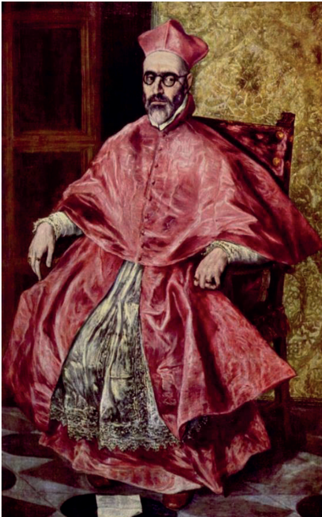
Figura 5. El Greco (1600). Cardenal Federico Niño de Guevara . Óleo sobre lienzo, 167 x 240 cm. Museo Metropolitano de Arte, Nueva York.

Para El Greco, la pintura del pontífice retrata el gesto determinante del inquisidor, que representa la autoridad y el poder de la Iglesia católica en el siglo XVII. Se restablece la inquisición como una reacción de la monarquía para proteger su poder y determinar las relaciones entre la Iglesia y el Estado, en la que el artista estaba inmerso y que realizaba para satisfacer los números encargos para el clero: