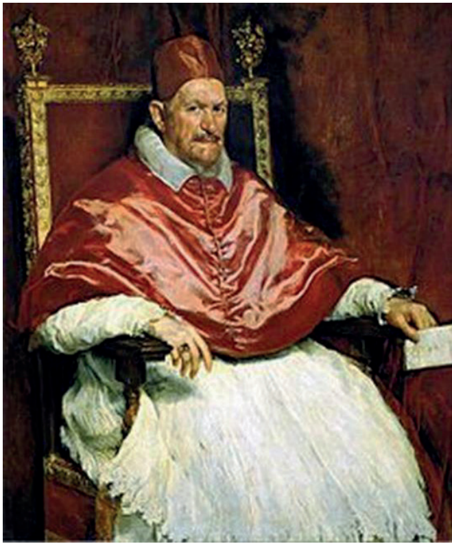
Figura 3. Velásquez [sic], D. (1650). Retrato del papa Inocencio X . Óleo sobre lienzo, 140 x 120 cm. Galería Doria Pamphili, Roma.

A diferencia de la obra original, el papa Inocencio X sujeta un periódico con su mano izquierda. El titular es “El teólogo de la liberación”. Se evidencia que Leonardo Boff se distancia, con una dura y amarga crítica, escrita por el Vaticano; debajo se ubica la fotografía de Leonardo Boff. El teólogo brasileño, exsacerdote franciscano condenado a un año de silencio obsequioso en 1985 por la Congregación de la Doctrina de la Fe tras la publicación de su libro Iglesia: carisma y poder. Ensayo de eclesiología militante , donde desarrolla sus ideas sobre la teología de la liberación y que en 1992 decide dejar la orden franciscana cuando estaba a punto de ser silenciado nuevamente. A la izquierda, de pie al lado de la silla ocupada por Inocencio X, proyectando una gran sombra en el interior, un figón con los brazos cruzados observándolo desde unos lentes oscuros.