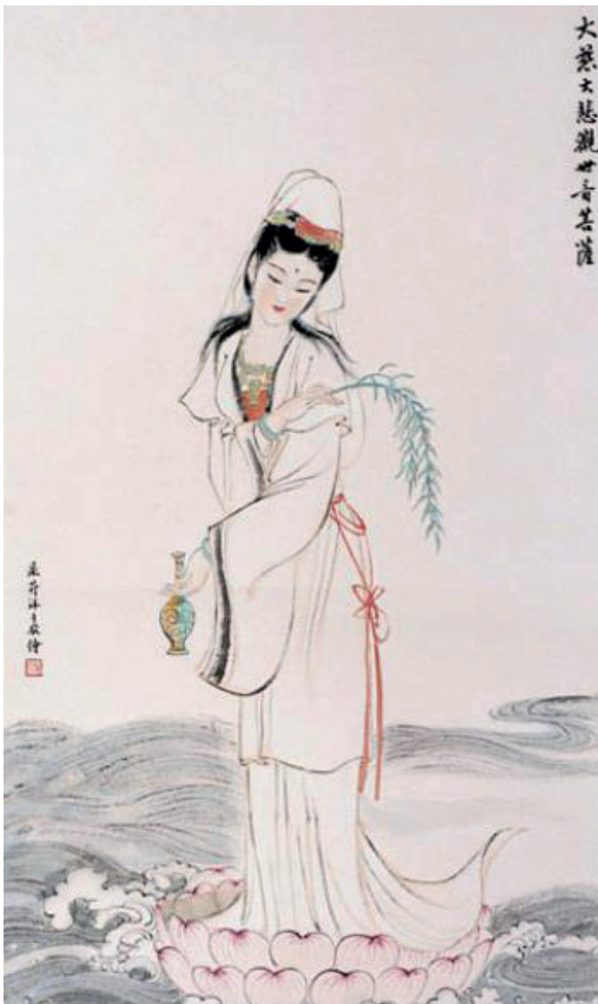
Imagen de la diosa Guan Yin.

XX. La imagen está en un marco dorado y se puede apreciar la figura femenina cargando a un bebé, así como tres personas adorándola, entre ellas la figura de un sacerdote. Aparte de este cuadro, en la sociedad china de Caibarién había una imagen de ella y con frecuencia los chinos hacían peregrinaciones allí. También en Cimarrones, en Matanzas, se celebraban fiestas en su honor (Crespo, 2016, p. 63). La tradición en Cuba hacia Guan Yin era de carácter sentimental, generalmente entre las mujeres; se recurría a ella cuando existía un problema de amores, le tomaban la mano suelta y le pedían ayuda para resolverlo. Una vez resuelto, se devolvía la mano a su lugar. Esto se hacía en anonimato, aunque aún no se resolviera el problema, se debía devolver la pieza o enfrentarse a un castigo de la deidad (Pong, 2019, p. 438).