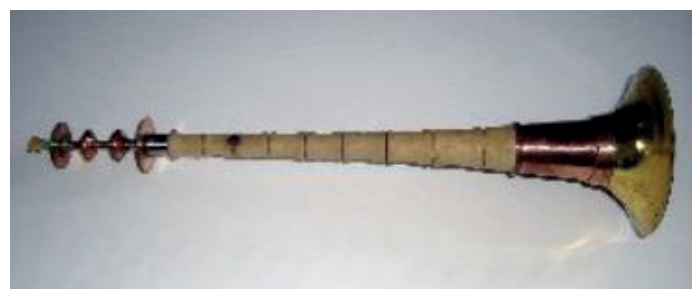
Imagen de la corneta china.