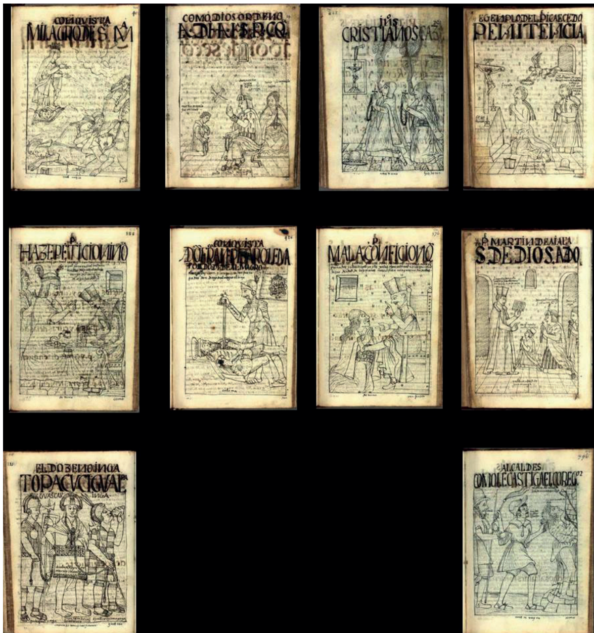
Figura 7. Guamán Poma de Ayala, F. (1615). Nueva corónica y buen gobierno .

[...] siendo bastante mayor escribió la principal crónica redactada por un indio sobre el mundo andino precolombino y el impacto de la colonia en los Andes. Además, era un fino dibujante y acompañó su texto con 400 dibujos que lo han hecho muy famoso en nuestros días. (p. 95)