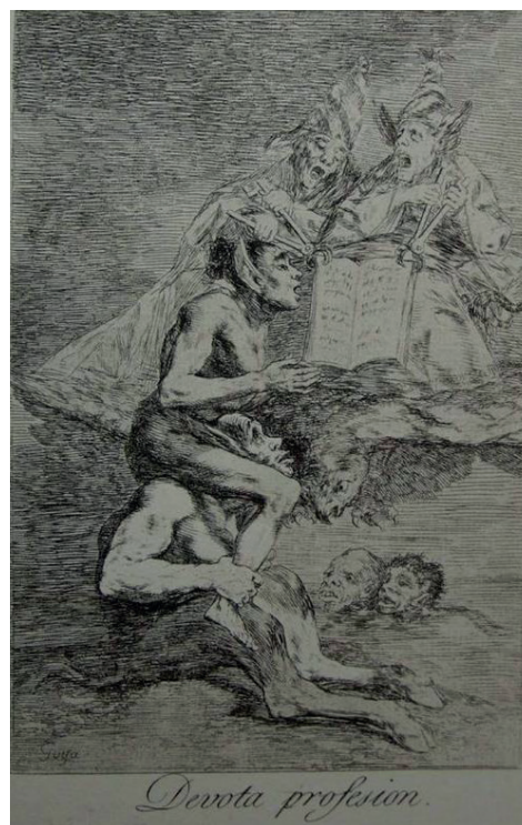
Figura 6. Goya, F. (1799). Devota profesión , parte de la serie Los caprichos . Aguafuerte, aguapunta, punta seca, 205 x 150 cm. Museo del Prado, Madrid.

¿Juras obedecer y respetar a tus maestras y superiores, barrer desvanes, hilar estopa, tocar sonajas, aullar, chillar, volar, guisar, untar, chupar, cocer, soplar, freír cada y cuando se te mande? Juro. Pues, hija, ya eres bruja, sea en hora buena. (Berea, 2007, p. 152)