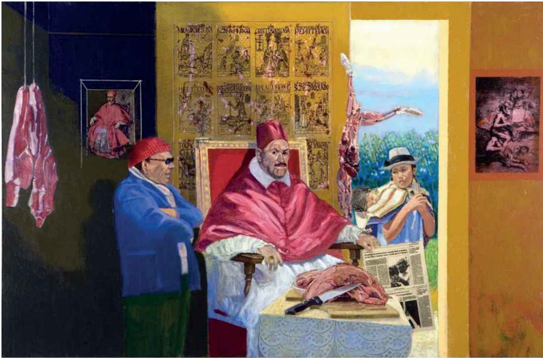
Figura 1. Braun-Vega, H. (2006a). El poder se nutre de dogmas (Velásquez [sic], Guamán Poma de Ayala, El Greco). Acrílico sobre tela, 116 x 89 cm.

En un formato rectangular y en una disposición horizontal, la obra muestra una habitación; en esta hay dos hombres en su interior, y en la entrada de la habitación, una mujer ingresa desde el exterior. En el interior, la escena está iluminada por una fuente de luz cenital y, en el exterior, por una fuente de luz solar que se esconde tras las nubes.