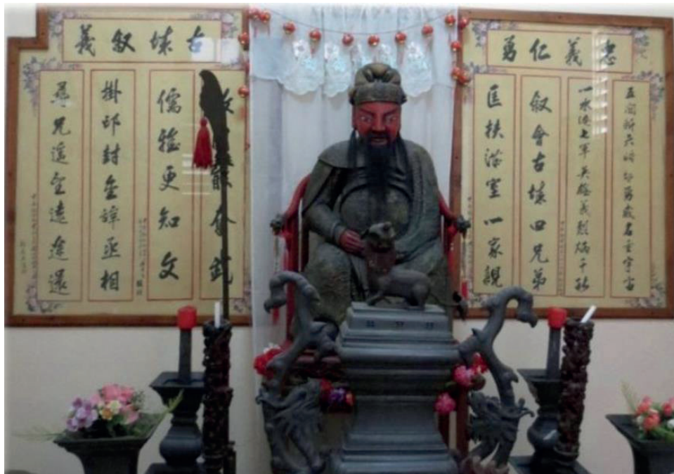
Imagen de San Fan Con en Cuba.

关羽, 160-220 d. C.). Es una de las figuras históricas más conocidas en la historia antigua. Fue un guerrero fuerte y un general victorioso de finales del siglo II d. C., famoso por su lealtad a Liu Bei (刘备), jefe militar y emperador del reino Shu (蜀国) durante la época de los Tres Reinos (Martín Nieto, s/f). En su vida como líder importante en los sangrientos conflictos de la caída del imperio Han, mostró audacia y justicia. Las hazañas de Guan Gong se recogen en El romance de los tres reinos , una de las cuatro novelas clásicas chinas. Tras su muerte, en 220 d. C., la figura de Guan Yu se divinizó como protector y defensor de las buenas causas, y se convirtió en el dios Guan Gong (Herraiz, s/f), que significa el “ancestro venerado Guan”. En general, las imágenes de Guan Gong se representan con el rostro pintado de rojo. Guan Gong es un guerrero viril, simboliza la lealtad, la disciplina y la generosidad, que son los ideales del buen guerrero. El rojo de su cara alude a la lealtad en la ópera tradicional china. Para los taoístas, Guan Gong es su dios de la guerra, mientras que los budistas le confieren un gran honor como su protector (Martín Nieto, s/f). Millones de chinos lo adoran y hacen esculturas de él para ponerlas en sus viviendas. Al salir a Cuba, los inmigrantes chinos llevaron unos ejemplares de Guan