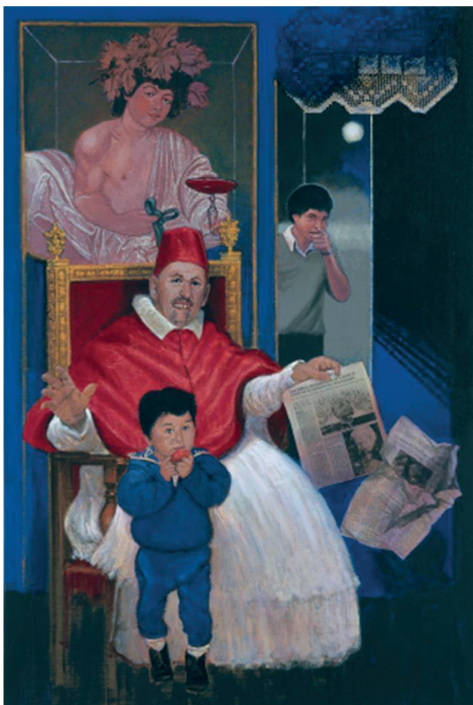
Figura 4. Braun-Vega, H. (2003). Deja que los niños pequeños vengan a mí... (Caravaggio) . Acrílico sobre tela, 146 x 96 cm.

Ese cuadro representa, en verdad, al papa Inocencio X, pintado por Velásquez [sic]. Y lo que lee es un periódico que comenta la pedofilia en la iglesia de los EE. UU. En el ángulo superior izquierdo hay un efebo —pintado por Caravaggio, artista homosexual protegido por los dignatarios del Vaticano, entre los que estaba el futuro Inocencio X. En la mano izquierda del papa hay un periódico que menciona los escándalos de pedofilia en los que se vio envuelto el Vaticano en el 2003. La sonrisa forzada y la mano derecha levantada simulan una defensa o una excusa gestual, ¿que acaso se refiere a la actitud hipócrita de la iglesia ante la sexualidad? En el umbral de la puerta, en el fondo, se ve a un joven que lanza su dedo acusador contra él/nosotros. Delante del papa, hay un niño mordiendo una manzana: ¿la próxima víctima? Es un ejemplo de las tres memorias. (Bauman, 2007, p. 102)