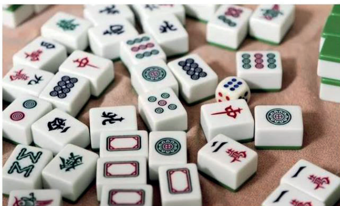
Juego del mahjong.

Desde el siglo XIX se creó en China un juego denominado mahjong ( má jiàng , 麻将) o machek ( má què , 麻雀) y que se ha practicado en la isla. Este comenzó en Cuba en el barrio chino, donde se le llama “dominó chino”. Tiene 144 fichas, aunque al principio solo contaba con 136, más tarde se le agregaron las 8 flores (Crespo, 2016, p. 148).