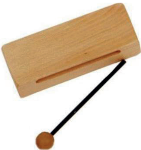
Imagen de la cajita china.

Dentro de la música folklórica-popular cubana, la cajita china se ha empleado de manera ocasional en la interpretación de géneros musicales propiciadores del baile, participando en el esparcimiento de amplios sectores de la población. Además, puede encontrarse entre los instrumentos de algunas agrupaciones de música cubana en ejecuciones de son y rumba. En algunas agrupaciones de rumba, la percusión con cajita china lleva la función de línea rítmica complementaria del conjunto instrumental, igual que las claves, pero con mayor volumen. En los conjuntos de son, a veces se usa en las pailitas cubanas o se toca junto con patrones de cencerro. Se aplica dentro del montuno, pero junto con su función rítmico-tímbrica se le explota para lograr contrastes tímbricos en mitad de una actuación improvisada (cfr. Casanaova, 1997).