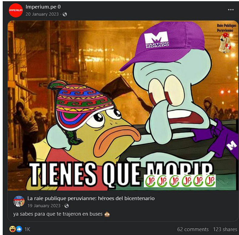
Imagen 2. "Tienes que morir". Imperium.pe.0.

Así pues, Imperium utiliza la función representativa del lenguaje, una vez más, para reproducir este discurso y añadirle un componente racial: el caviar manda al terruco, con vestimenta andina, a morir. Puede interpretarse, de forma más matizada, que la función apelativa también aparece: no te dejes instrumentalizar por los caviares.