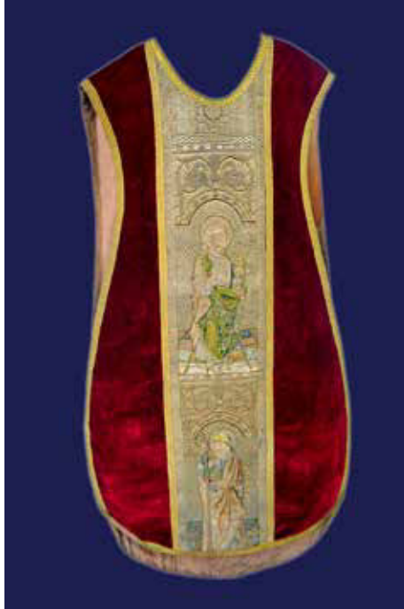
Imagen 4: Casulla de los Apóstoles (sección delantera). Siglo XVI Catedral de Lima.

En el segmento inferior está Santiago el Mayor, su rostro en tres cuartos se dirige hacia la izquierda. Ostenta el bordón 12 que sujeta con la mano derecha y está tocado con un sombrero. Tanto el bordón como el sombrero lo caracterizan como peregrino. Sobre el pecho lleva una amplia capa roja terciada que deja ver su túnica azul. No se aprecian sus pies, tampoco el piso, debido a que la columna ha sido recortada para ser adaptada a la forma redondeada de la casulla.