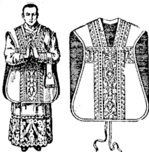
Imagen 4: Casulla.

El sacerdote lleva la casulla sobre los demás ornamentos sagrados (imagen 4). Fue considerada desde la Edad Media como símbolo de la caridad que reúne todas las demás virtudes, y también representa el yugo del Señor.