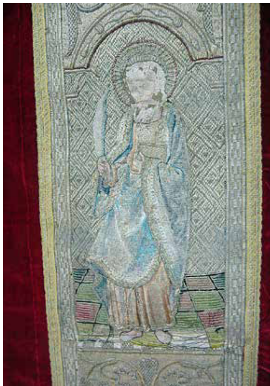
Imagen 3: San Bartolomé. Casulla de los Apóstoles (detalle de la espalda). Siglo XVI. Catedral de Lima. Fotografía: Patricia Victorio C.

Se observa la frente mutilada por la escotadura para el cuello. Catedral de Lima. Fotografía: Patricia Victorio C.