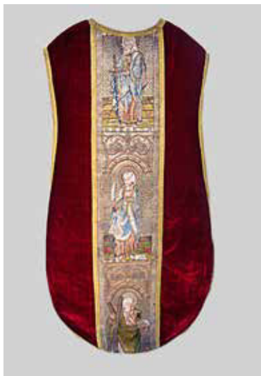
Imagen 1: Casulla de los Apóstoles (sección de la espalda). Siglo XVI. Catedral de Lima.