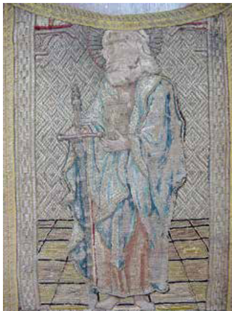
Imagen 2: San Pablo. Casulla de los Apóstoles (detalle de la espalda). Siglo XVI