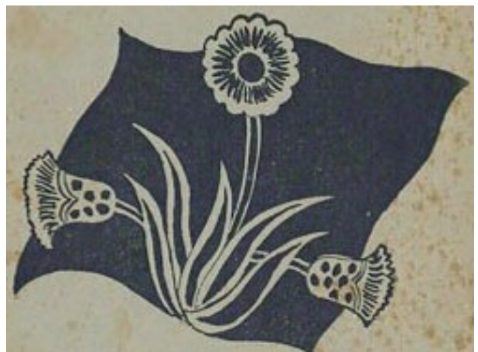
Figura 3. Ilustración de Alicia Bustamante (Arguedas, 1941, p. 1). Foto: Biblioteca Nacional del Perú, 2020.

Bustamante Vernal ilustró la “carátula” del libro Yáwar fiesta (Arguedas, 1941). La tapa del libro de color marrón claro tiene una tipografía negra. En el margen superior lleva el título “ Yáwar fiesta ”, y en el margen inferior el nombre del escritor “José maría Arguedas” [sic] (Arguedas, 1941). En la parte central figura una planta (véase imagen 3) compuesta por tres inflorescencias, dos laterales de perfil y una en medio, del suelo crecen cinco hojas lanceoladas verticales acomodadas en forma de roseta. Detrás de la planta a manera de fondo ondea una tela cuadrangular de color marrón oscuro. Además, se percibe en la contracarátula el dibujo de la misma planta de la portada (Arguedas, 1941), que está conformada por dos inflorescencias de perfil entrecruzadas con sus hojas lanceoladas dispuestas en forma de roseta.