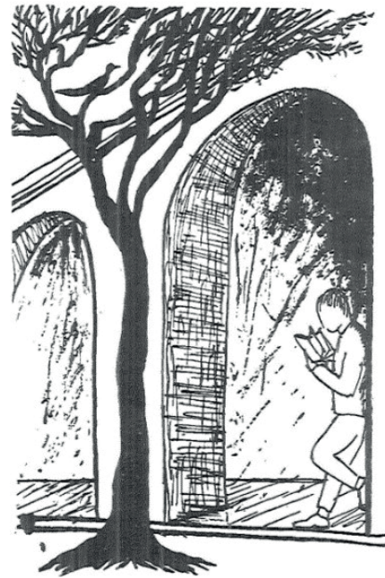
Figura 10 Ilustración de Alicia Bustamante (Arguedas, 1954, p. 45).

el lado izquierdo del vano del arco de medio punto representa a Salcedo. En la historia se menciona que él “leía, mientras paseaba” en el colegio (Arguedas, 1954, p. 45).