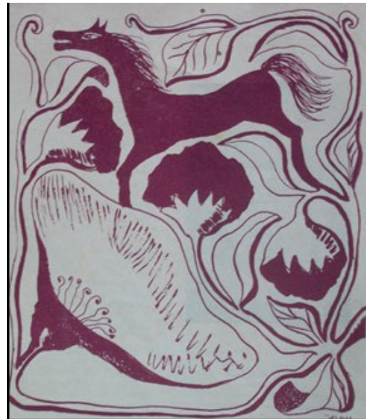
Figura 9 Ilustración de Alicia Bustamante (Arguedas, 1951, p. 4).

La planta, por sus inflorescencias cerradas en forma de campana, junto a un brote en flor, indica dos estadios diferentes de crecimiento. Por citar un ejemplo, las flores en el arte llevan un mensaje implícito debido a que “en capullo corresponden a la juventud [...] y las flores con sus hojas expresan que ya está entrando a otra etapa de su vida” (Verde Márquez, 2016, p. 149). Se puede hacer extensivo