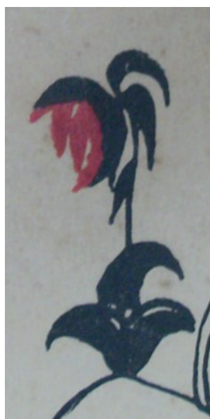
Figura 1. Detalle de la ilustración de Alicia Bustamante en Canto kechwa (Arguedas, 1938, p. 1). 2

Arguedas (1938) recopiló veintidós canciones de la tradición andina para su libro Canto kechwa . El texto está escrito en dos idiomas: el quechua y su traducción al español. Bustamante Vernal realizó la ilustración de la carátula y los “dibujos” del libro (Arguedas, 1938, p. 3).