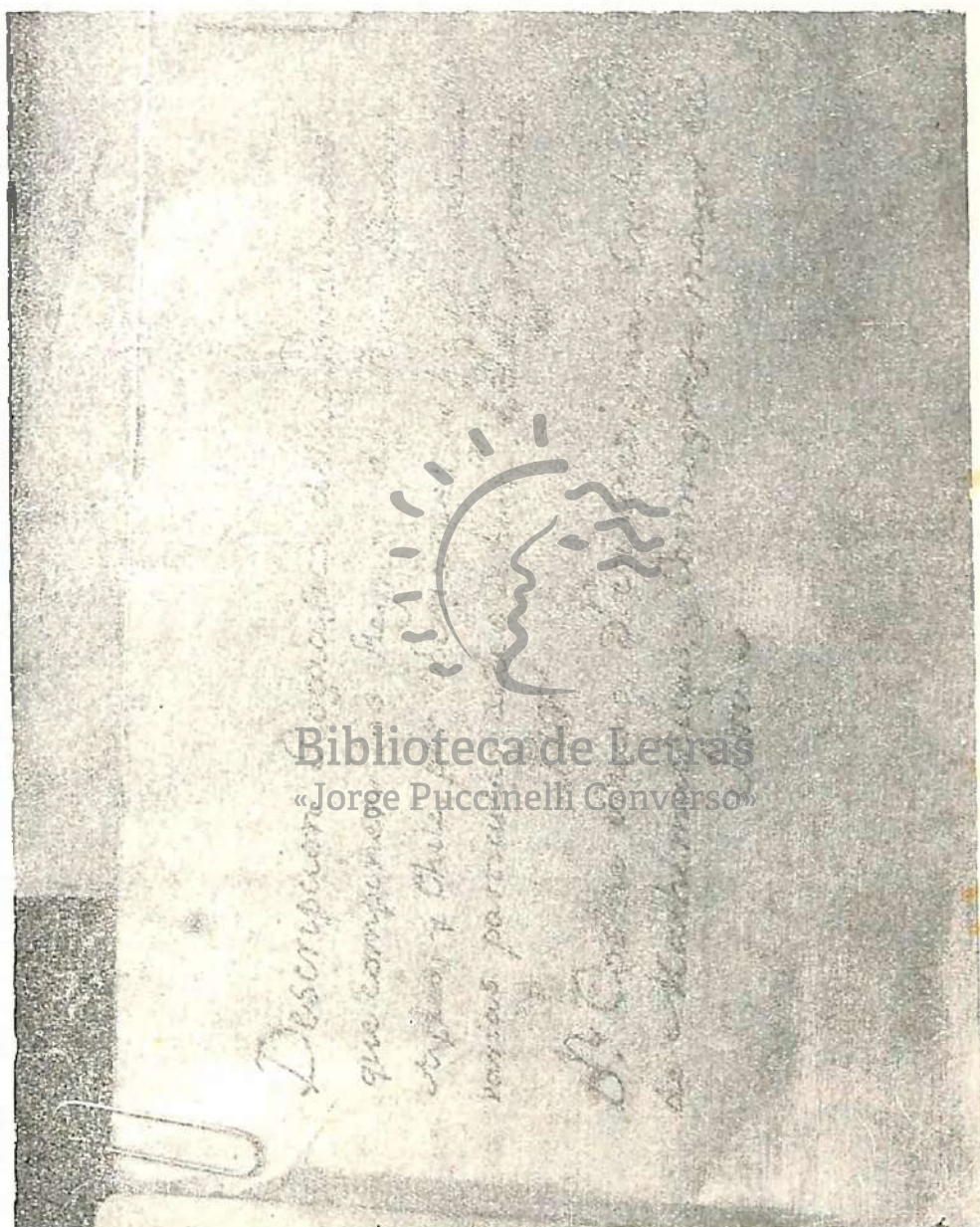
Portada del manuscrito de don Cosme Bueno (copia del siglo XVIII, existe en la MEMORIA PRADO),