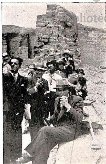
Tapial de adobes del ala izquierda.