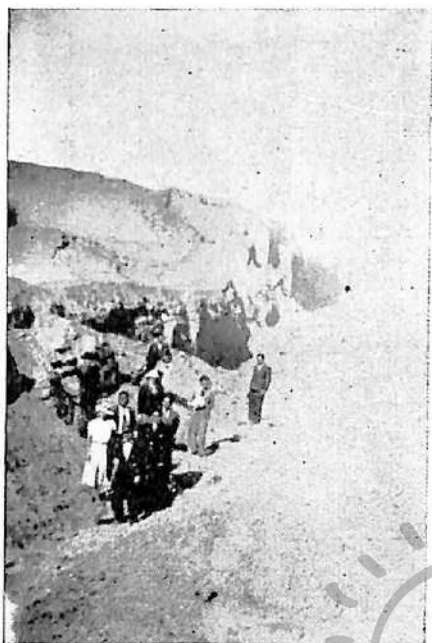
La Calle de las "Ofrendas"