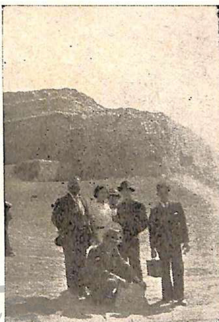
Perspectiva de la más importante terraza con estucado rojo del "Templo del Sol".