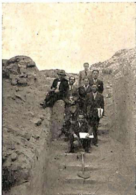
Escalinata de piedras y pórtico de la segunda plataforma. Lado oriental del Santuario.