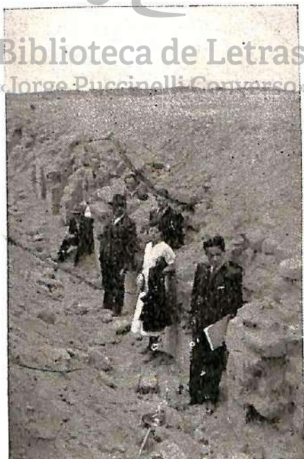
Hornacinas trapezoidales de la tercera plataforma, para colocar arribalos, en el "Convento de las Mamaconas".

Biblioteca de Letras «Jorge Puccinelli Converso»