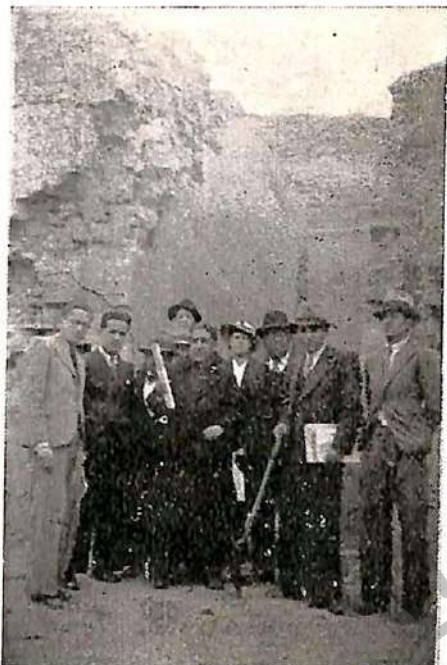
Pórtico y vestíbulo de la primera plataforma del "Templo del Sol".