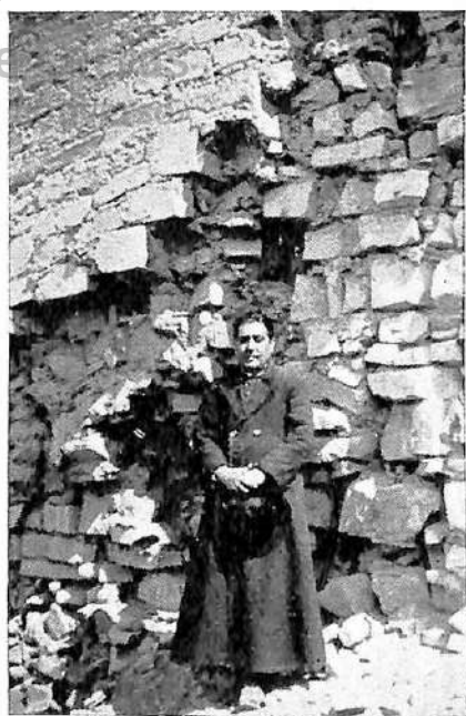
Sillería que muestra un aparejo irregular, "emplectonal".