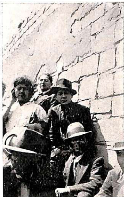
Sillería de aparejo regular, "isodomon"