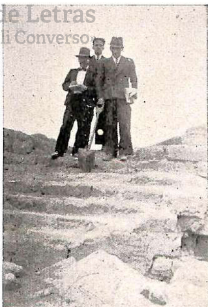
El altar de los Sacrificios en el Santuario de "Inti" que se encuen- tra en la plataforma de la cumbre.