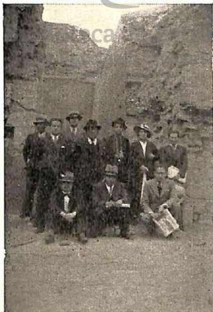
Pórtico trapezoidal con nicho vestibular; cimiento del edificio con piedras sillares y paramento de grandes adobes.