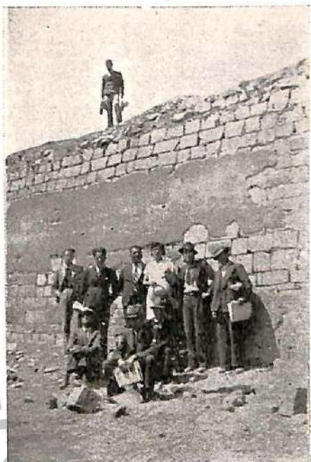
Paramento de piedras talladas, tipo cúbico, "isodomon", recubierto por un estuque de color rojo.