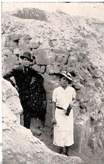
Santuario de Pachacámac. Pre- Incaico con adobes odontiformes.